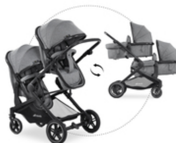
CONVERTIBLE SEAT UNITS

In der Babywanne haben es deine Babys kuschelig weich und gemütlich. Sobald sie sitzen können, geht es im Sportsitz weiter. Da ist die Lehne verstellbar. So können sich deine Kinder auch mal ausruhen.