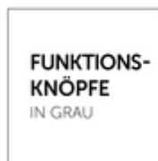
FUNKTIONS- KNÖPFE IN GRAU