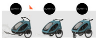
VOM FAHRRADANHÄNGER ZUM BUGGY