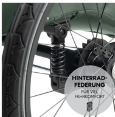
HINTERRAD- FEDERUNG FÜR VIEL FAHRKOMFORT

Bordstein rauf, Bordstein runter, Kopfsteinpflaster - egal! Im Dryk Duo Plus mit Hinterradfederung und Lufträdern an der Hinterachse sitzen deine Kinder auch auf holpriger Strecke richtig gemütlich.