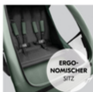
ERGO- NOMISCHER SITZ