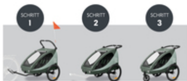
VOM FAHRRADANHÄNGER ZUM BUGGY