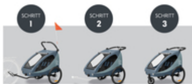
VOM FAHRRADANHÄNGER ZUM BUGGY