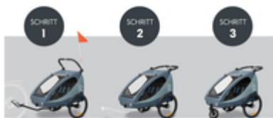
VOM FAHRRADANHÄNGER ZUM BUGGY