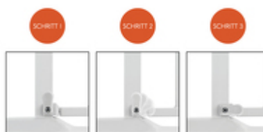
DAS TÜR- UND TREPPENSCHUTZGITTER KANN IN BEIDE RICHTUNGEN GEÖFFNET WERDEN