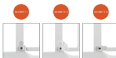
DAS TÜR- UND TREPPENSCHUTZGITTER KANN IN BEIDE RICHTUNGEN GEÖFFNET WERDEN