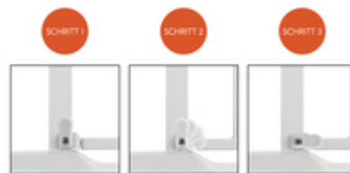
DAS TÜR- UND TREPPENSCHUTZGITTER KANN IN BEIDE RICHTUNGEN GEÖFFNET WERDEN