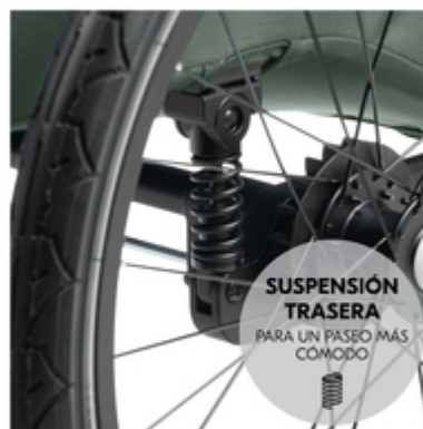
SUSPENSIÓN TRASERA PARA UN PASEO MÁS COMODO

Bordillo arriba, abajo, adoquines... ¡da igual! En la Dryk Duo Plus con suspensión trasera y ruedas neumáticas en el eje trasero, tus peques irán cómodos incluso en carreteras llenas de baches.