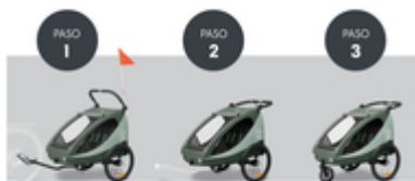
DE REMOLQUE PARA BICICLETA A SILLA DE PASEO