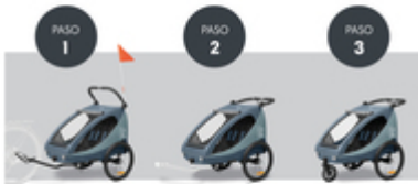
DE REMOLQUE PARA BICICLETA A SILLA DE PASEO