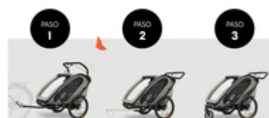
DE REMOLQUE A SILLA DE PASEO O A MODO DEPORTIVO