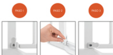
LA PUERTA DE SEGURIDAD PARA PUERTAS Y ESCALERAS SE ABRE HACIA AMBOS LADOS