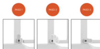
LA PUERTA DE SEGURIDAD PARA PUERTAS Y ESCALERAS SE ABRE HACIA AMBOS LADOS