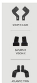
SHOP N CARE