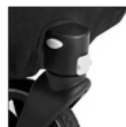
FUNCTION BUTTONS IN GREY