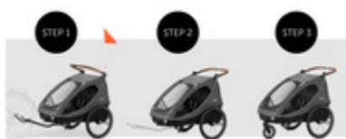
FROM BIKE TRAILER TO BUGGY