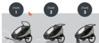
DE LA REMORQUE DE VÉLO À LA POUSSETTE