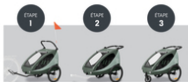
DE LA REMORQUE DE VÉLO À LA POUSSETTE