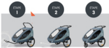
DE LA REMORQUE DE VÉLO À LA POUSSETTE