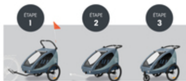
DE LA REMORQUE DE VÉLO À LA POUSSETTE