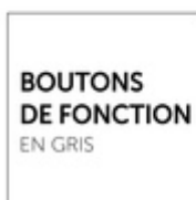
BOUTONS DE FONCTION EN GRIS