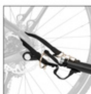
FACILE À MONTER AU VÉLO

La fixation du Dryk Duo à votre vélo est très simple et vite. Le timon est livré avec sac de rangement étant toujours à portée de main. Grâce à son système de verrouillage double, il connecte la remorque et votre vélo de façon sûre.