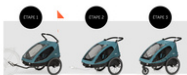
DE LA REMORQUE À LA POUSSETTE