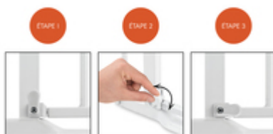
BARRIÈRE SE PEUT OUVRIR DANS LES DEUX SENS