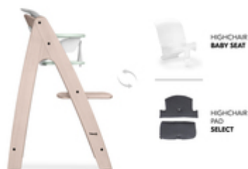
ACCESSOIRES VENDUS SÉPARÉMENT