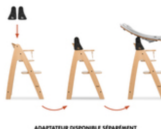
ADAPTATEUR DISPONIBLE SÉPARÉMENT