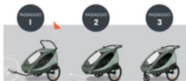
DA RIMORCHIO PER BICI A PASSEGGINO