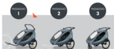
DA RIMORCHIO PER BICI A PASSEGGINO