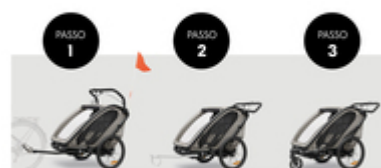
DA RIMORCHIO A PASSEGGINO O IN MODALITÀ SPORTIVA