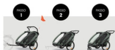
DA RIMORCHIO A PASSEGGINO O IN MODALITÀ SPORTIVA