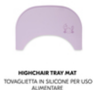
HIGHCHAIR TRAY MAT TOVAGLIETTA IN SILICONE PER USO ALIMENTARE