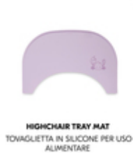
HIGHCHAIR TRAY MAT TOVAGLIETTA IN SILICONE PER USO ALIMENTARE